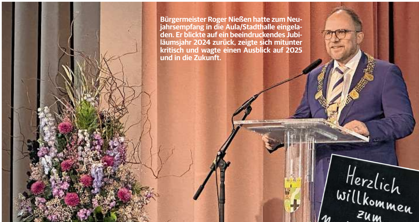
Bürgermeister Roger Nießen hatte zum Neujahrsempfang in die Aula/Stadthalle eingeladen. Er blickte auf ein beeindruckendes Jubiläumsjahr 2024 zurück, zeigte sich mitunter kritisch und wagte einen Ausblick auf 2025 und in die Zukunft.