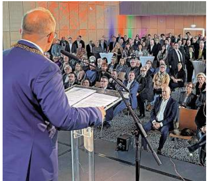
Bürgermeister Roger Nießen freute sich über zahlreiche Gäste beim Neujahrsempfang 2025.